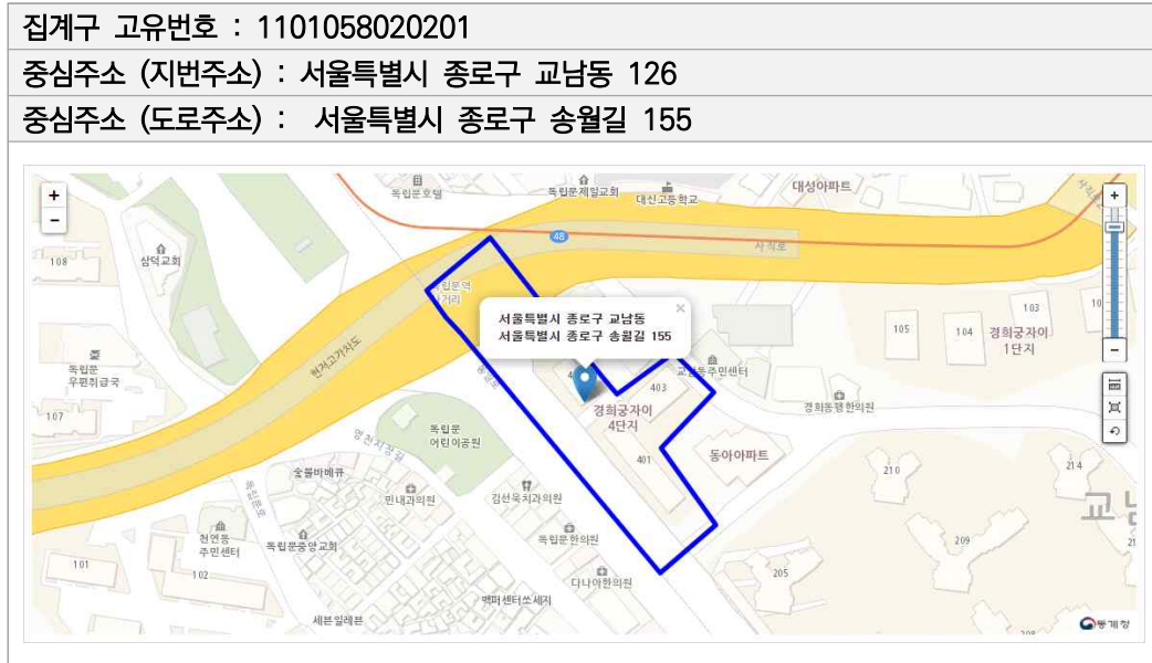
[그림 1] 집계구 지도