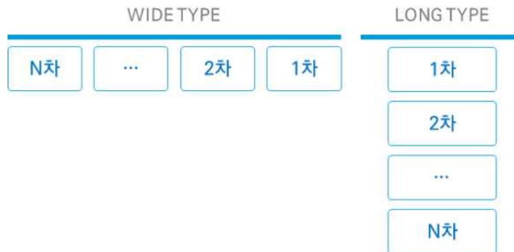
[그림 4-2] 통합 데이터 구성