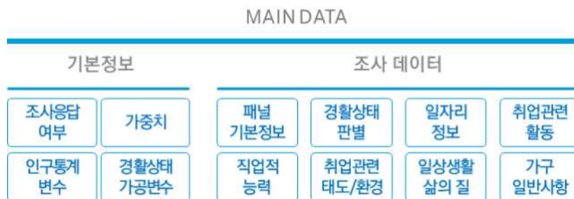
[그림 4-1] 메인 데이터 구성