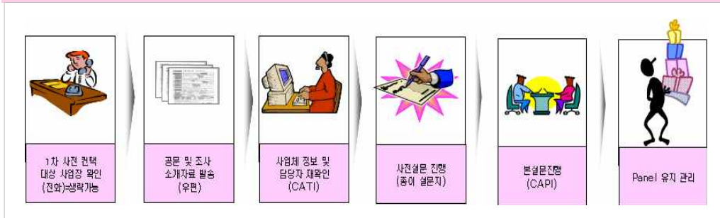
[그림4] 사업체패널조사 진행단계