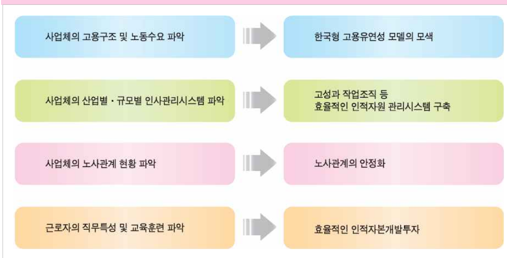
[그림1] 사업체패널조사의 목적과 기대효과