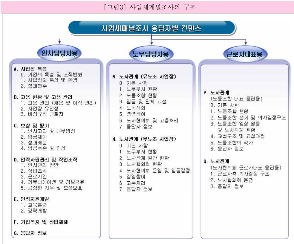
[그림3] 사업체패널조사의 구조